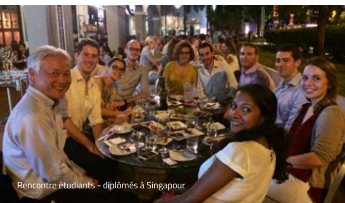
Rencontre étudiants - diplômés à Singapour